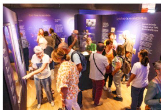
Inauguration de l'exposition « L'or et le geste. Le torque de Montans », 18 septembre 2025.