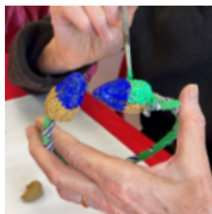
Nouveaux ateliers de création de torques pop !