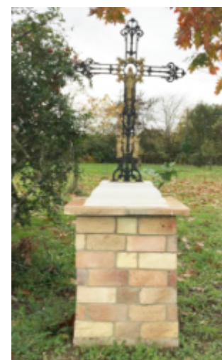
Route de Riols