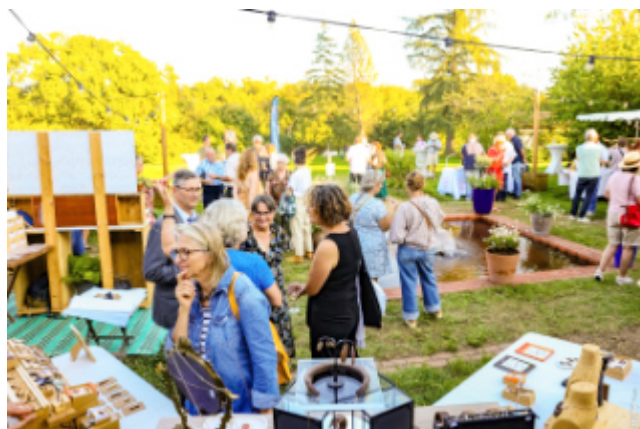
Marché de créateurs dans le jardin du musée à l'occasion de l'inauguration de l'exposition « L'or et le geste. Le torque de Montans », 18 septembre 2025.

Les Journées de l'Archéologie en juin marqueront le début de la saison estivale du musée.