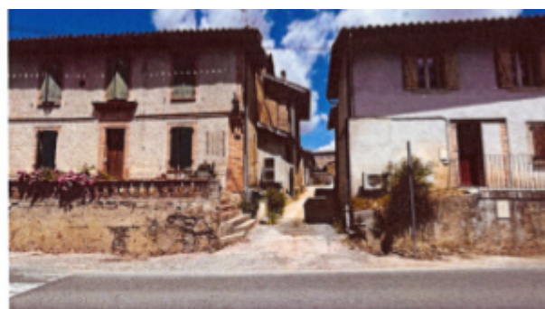
Photographie témoignant des qualités urbaines des faubourgs (alignements, gabarits, hauteurs, clôtures...)