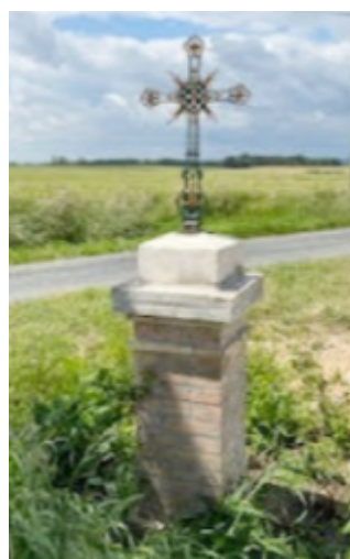
Route de la Brunerie Basse

Merci à eux pour cette belle initiative. N'hésitez pas à vous y arrêter pour les découvrir.